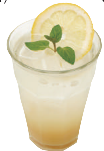
自家製ジンジャーエール