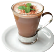
ホットチョコミント