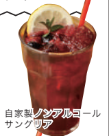
自家製ノンアルコール サングリア

ぶどうジュースにビタミンたっぷりのフルーツを漬けた、とってもジューシーなドリンクです。ノンアルコールなのでお子様にもおすすめです。