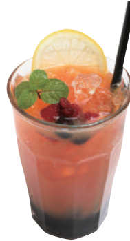
ラズベリーティーソーダ