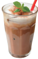
アイスチョコミント