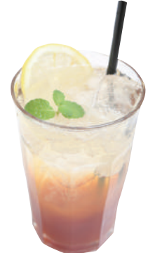
はちみつレモンのティーソーダ