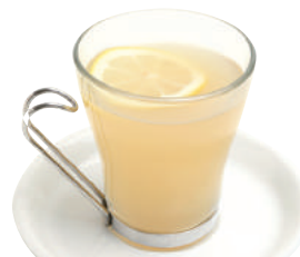
自家製ホットジンジャー