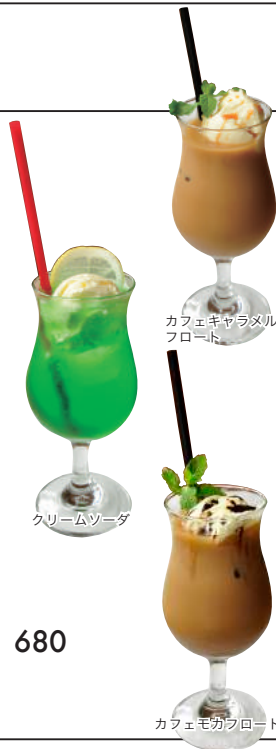
カフェキャラメルフロート